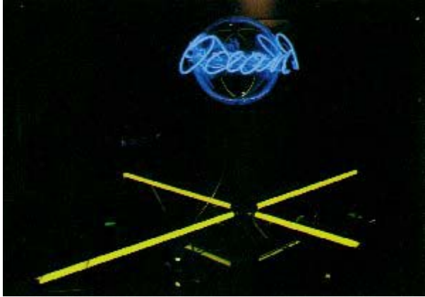
Jürgen Claus: Installation "Planet Ocean", mit Argonschriftzug, auf Glaskugel, vier Glasbecken mit blauem Wasser gefüllt, gelben Neonstäben, Videotape, Ausstellung "Kunst und Technik", BMW München 1984.