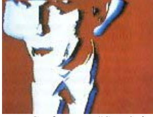
Inge Graf + Zyx: "Step/Vier To Electronic Futurism", 1985