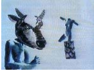
Inge Graf + Zyx: "Mintoaurus", 1983