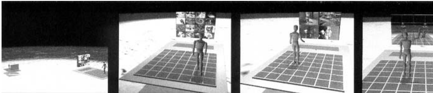
Projektgruppe Netzstadt (TH Darmstadt): "Fließgleichgewicht"

Laszlo Moholy-Nagy informierte über Telefon 1922/23 einen Mitarbeiter einer Porzellanmanufaktur über die Formen und Farben einer Komposition mittels gerastertem Papier und Farbkarte. Präsentationen mit eingebrenntem Emaille wurden in drei Größen realisiert. Das Resultat war trotz Verzicht auf individuelle Handschrift immer noch ein isoliertes Kunstobjekt.